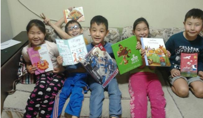
Blij met een cadeautje van de sponsors!

Ps.127: "Als de Here het huis niet bouwt, tevergeefs bouwen de bouwlieden daaraan..."